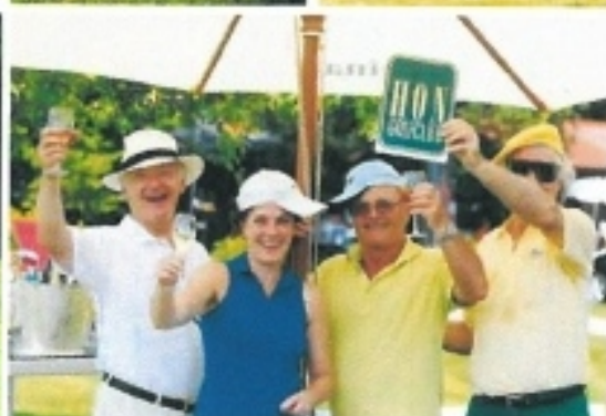
Immer mit viel Spaß bei der Sache – die Mitglieder des Golfclubs HON