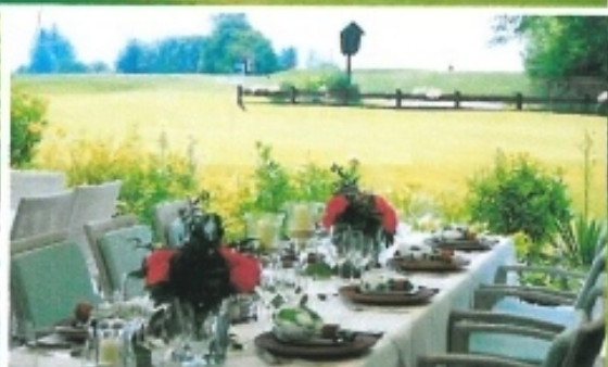
Auf der Restaurantterrasse genießt man die Kulinarik sowie die herrliche Aussicht

Zudem erlauben die im letzten Jahr gebauten Cartwege das Fahren mit Buggys auch bei Regenwetter und nassem Boden. Das Clubhaus wurde 1984 vom Wolfratshauer Architekten Tom Ferster im zeitlos edlen Landhausstil erbaut. Weil es sich perfekt in die Landschaft fügt, hat es bis heute nichts von seinem Charme verloren. Im Haupthaus befinden sich das Sekretariat und das gemütliche Restaurant. Angrenzend an die riesige überdachte Terrasse, die Platz für 200 Gäste bietet, befindet sich der Loungebereich mit Liegestühlen und Sofas für entspanntes Après-Golf. Für die „Zwergerl“ ist neben dem Clubhaus ein Kinder-Blockhaus mit angrenzendem Spielplatz gebaut worden. An jedem Wochenende und an zwei Tagen während der Woche beaufsichtigen Kindergärtnerinnen unsere Kleinen, sodass die Eltern ganz entspannt Golf spielen können.