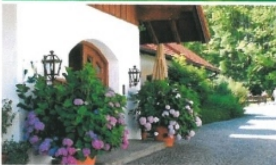
Der Eingang zum Haupthaus und Golfclub