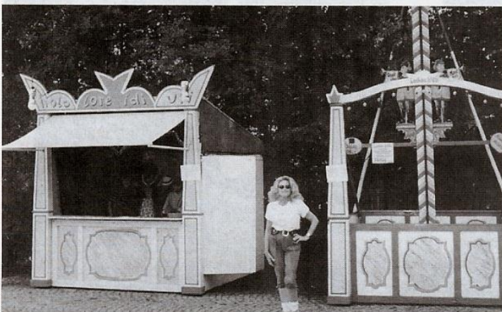
Stilreicher Rahmen, wie die historische Wurf-bude und der antike „Hau den Lukas“ kennzeichnen das traditionelle Oktoberfest-Turnier in Beuerberg.